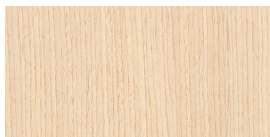
Fehérített tölgy/Bleached oak